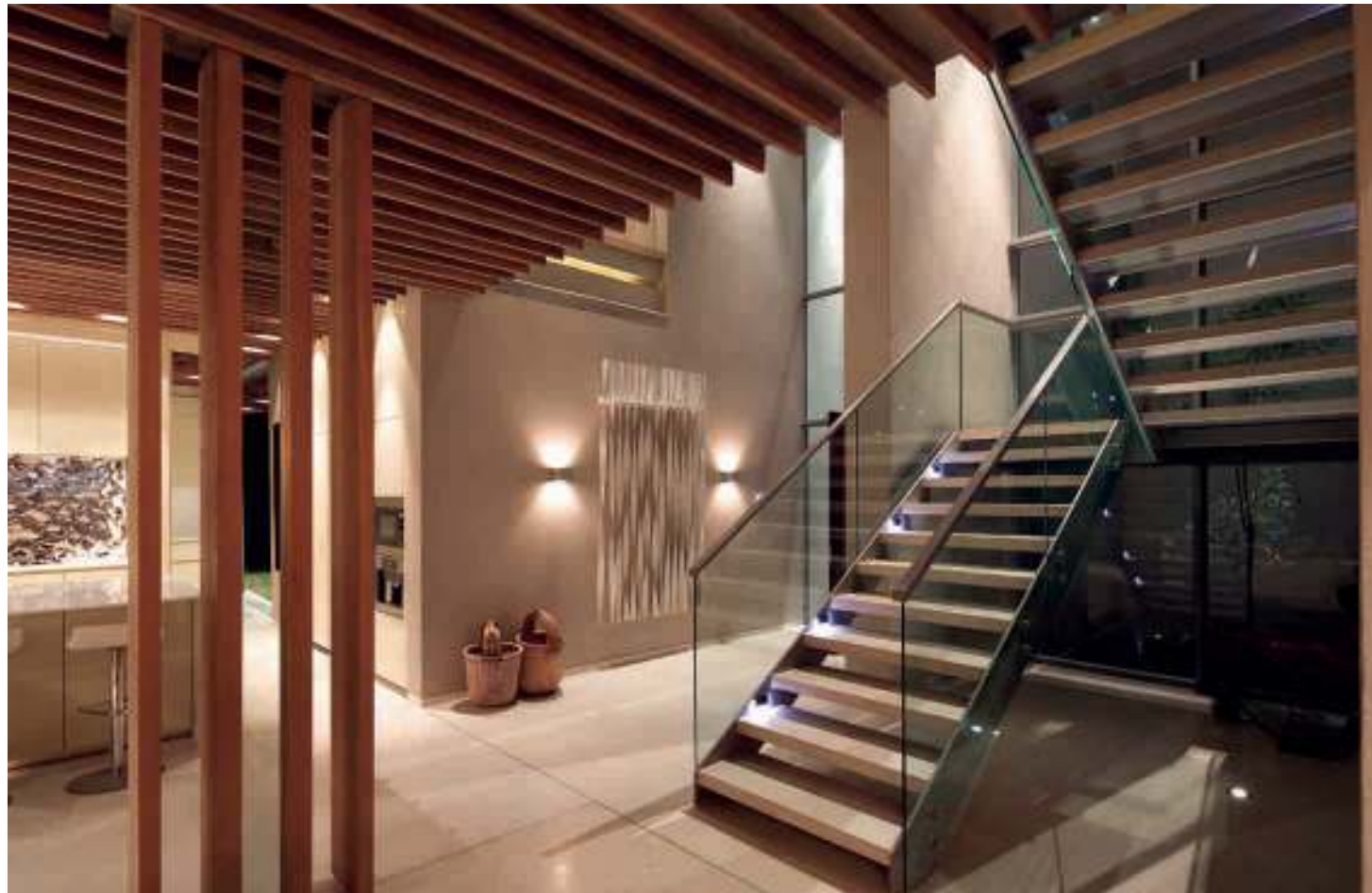
Nella pagina a sinistra: in alto, vista del salottino e del camino della camera padronale, con il balcone e le pareti mobili sullo sfondo; in basso, vista dell'ingresso su due volumi con la scala a pedata libera. In questa pagina, il bagno padronale con il particolare box doccia e la parete verticale ricoperta di pietra arenaria. Nelle pagine precedenti, pareti mobili circondano e avvolgono le zone esterne, come si vede dalla zona living On the left, top: view of master bedroom sitting and floating fireplace area with balcony and sliding screens as backdrop; bottom: view of double volume entrance area and open tread staircase. Above: master bathroom with sandblasted shower screen and sandstone clad vertical wall. Previous pages: sliding screens envelope and cocoon external living spaces as viewed from the living area